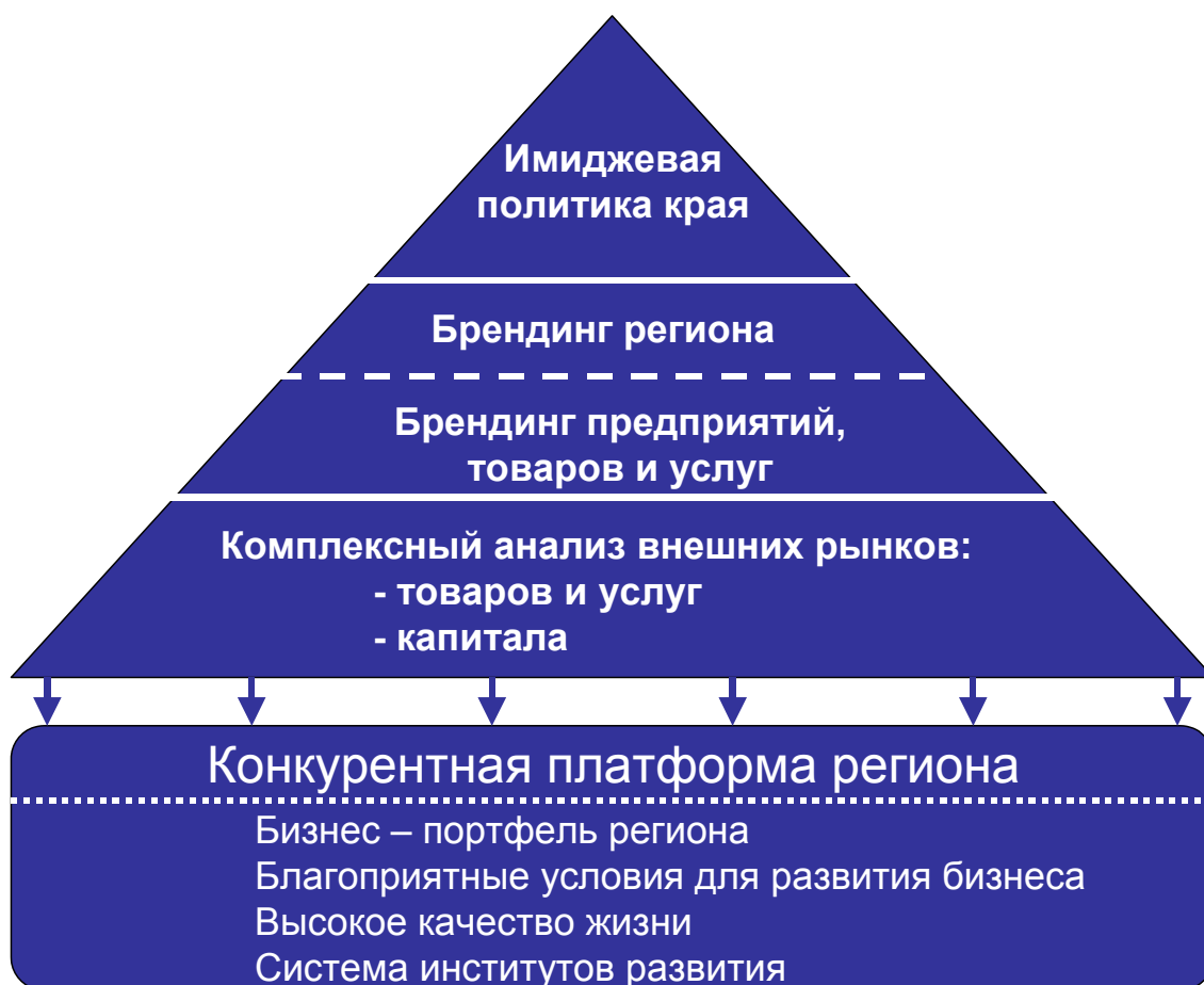
Рисунок 6. Система продвижения интересов края на внешние рынки

Исходя из данного системного представления имиджевая политика края должна: