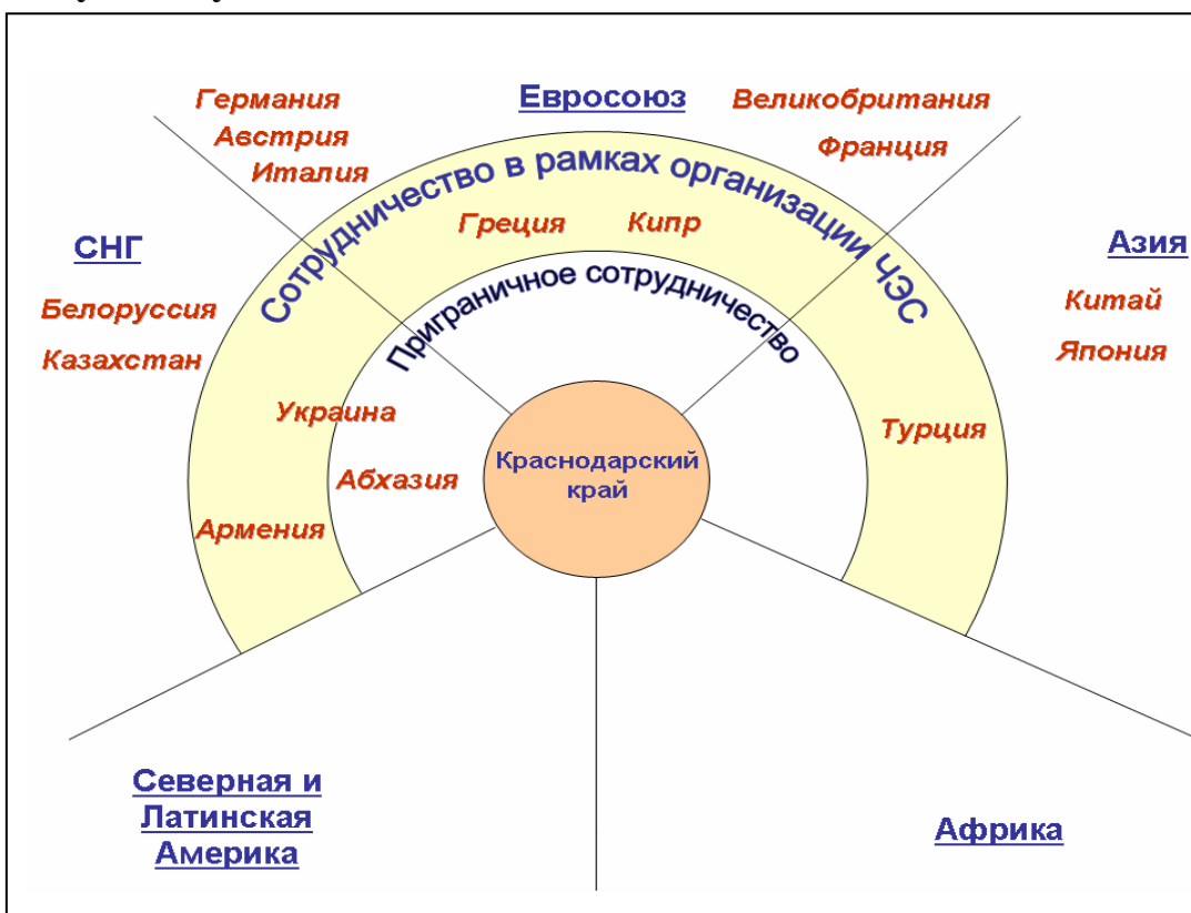
Рисунок 3. География международного сотрудничества Краснодарского края – перспективные страны